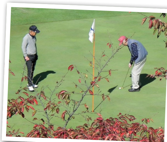
10/19 ゴルフ あつみ野カントリークラブ