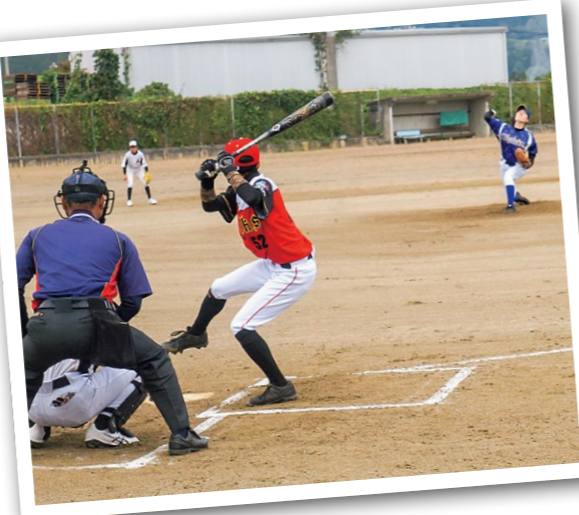
10/9 軟式野球 堀金総合運動場、県民豊科運動広場