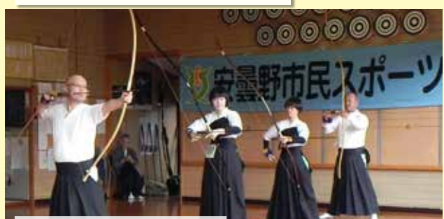
弓道競技10/10日(祝) 豊科弓道場