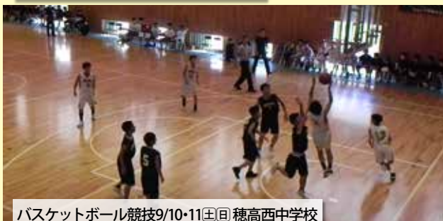
バスケットボール競技9/10・11日(土) 穂高西中学校