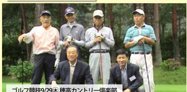
ゴルフ競技9/29日(祝) 穂高カントリー倶楽部