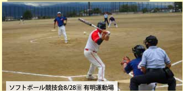
ソフトボール競技会8/28日 有明運動場