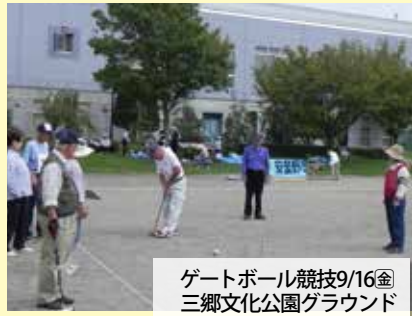
ゲートボール競技9/16日 三郷文化公園グラウンド