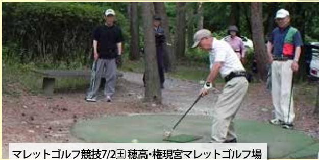
マレットゴルフ競技7/2日 穂高・権現宮マレットゴルフ場