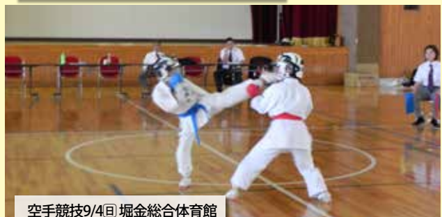
空手競技9/4日 堀金総合体育館