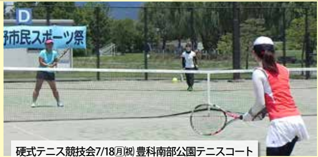
硬式テニス競技会7/18日(祝) 豊科南部公園テニスコート