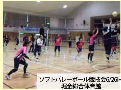
ソフトバレーボール競技会6/26日 堀金総合体育館