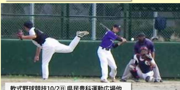
軟式野球競技10/2日 県民豊科運動広場他