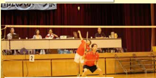
バドミントン競技10/9日 三郷文化公園体育館