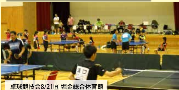
卓球競技会8/21日 堀金総合体育館